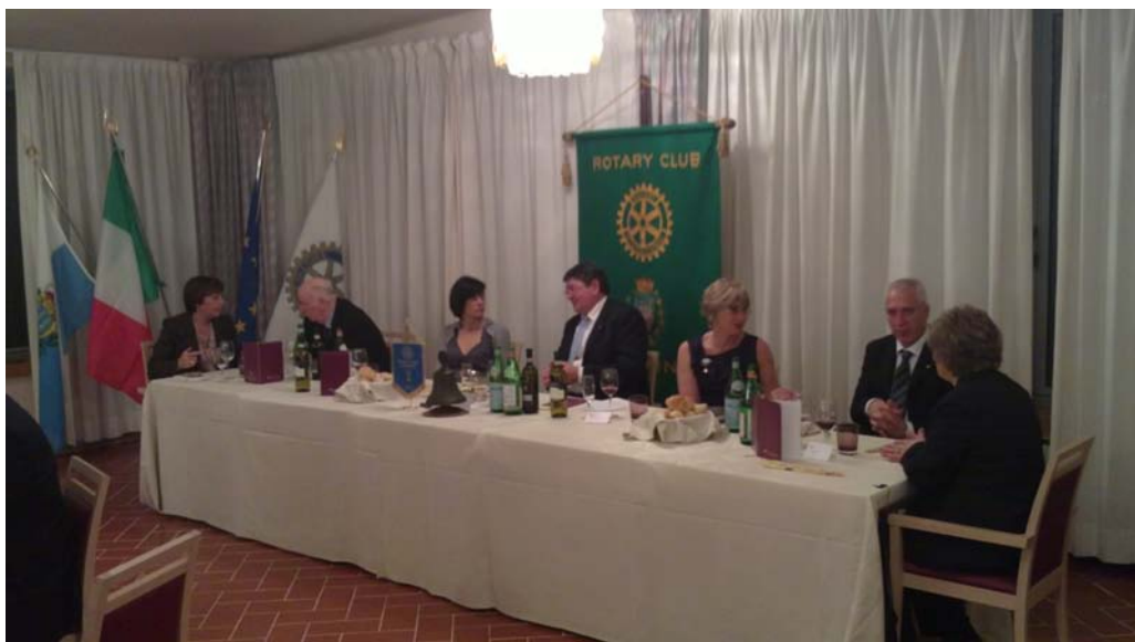
Il tavolo della Presidenza al Concerto di Primavera