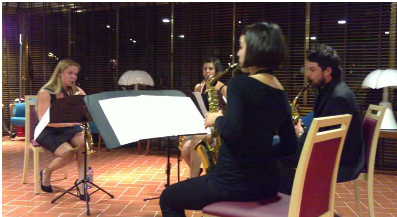
Il quartetto “ExclusIVe” durante il concerto