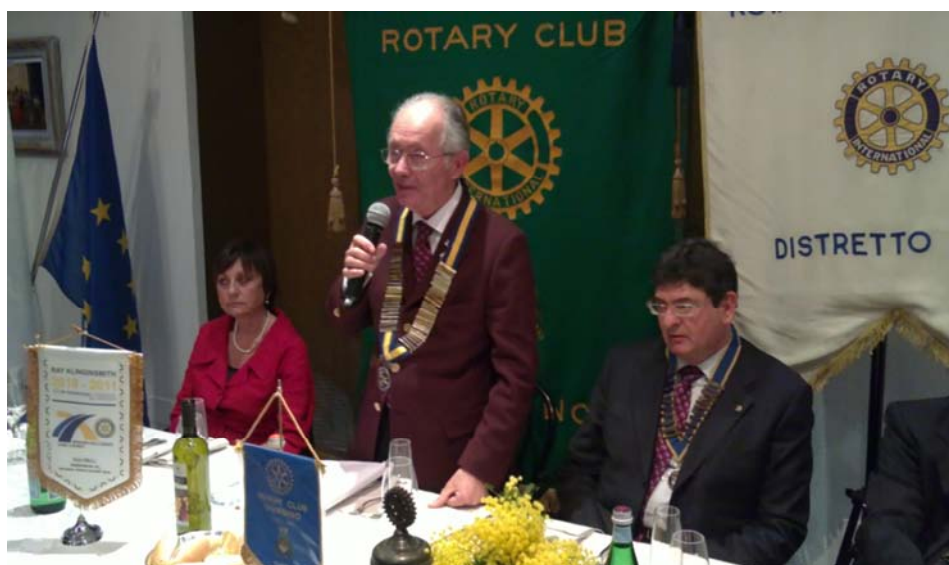
Il discorso del Governatore Rag. Vinicio Ferracci